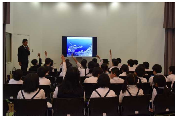
クイズに元気に答える様子

講座中は、海外から輸入される石炭、鉄鉱石や実際に灯台に使われているガラスなどの実物を見たり、港や海面清掃兼油回収船「美讚」についてメモを取る姿が見られました。