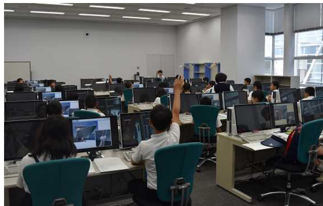
「美讚」について質問する様子

講座中は、「美讚」のペーパークラフトや実際に灯台に使われているガラスなどを手にとって学習し、港や海面清掃兼油回収船「美讚」についてメモを取る姿が見られました。