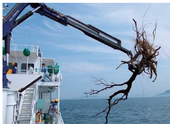
(参考)流木の回収状況

「美讚」の自慢は、瀬戸内海をきれいにしていること！流木などをつかめる多関節クレーンも活躍しています！