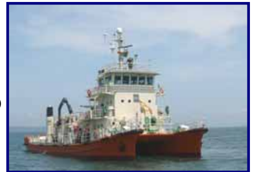
海面清掃兼油回収船「わしゅう」