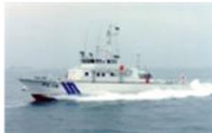
高松海上保安部巡視艇「くりなみ」