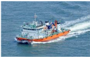
海面清掃兼油回収船「美讃」