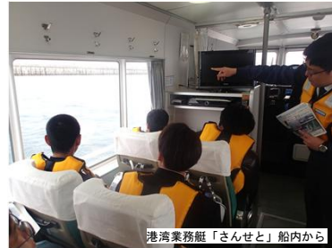
港湾業務艇「さんせと」船内から