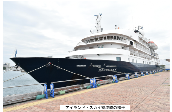
アイランド・スカイ寄港時の様子

4月17日にクルーズ船「アイランド・スカイ」が高松港へ初入港しました。アイランド・スカイは全長91m、乗客定員約100人の小型探検クルーズ船で南極にも航行できるとのことです。出港時には高松城鉄砲隊の演武もあり多くの人で賑わっていました。令和8年の高松港へのクルーズ船寄港数は、昨年より1隻増の22隻の予定です。本年も国内外のお客様で高松港がにぎやかになることが期待されます。