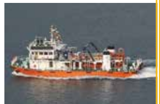
▲海を浮遊するゴミや油を回収する「美讚」

【日時】7月15日(月) 10:00～15:30 (最終受付15:00) 【場所】高松港サンポート(旅客船ふ頭横) 【内容】浮遊ごみや浮遊油を回収する「美讚」を一般公開します。 ・船内見学(操舵室、作業甲板) ・パネル展示 ・船員服試着&記念撮影 【問合せ先】 高松港湾・空港整備事務所 企画調整課 TEL:087-851-5524