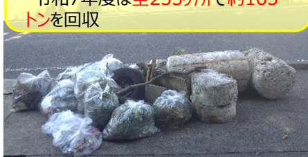
リフレッシュ瀬戸内(R6.7.28) 笠岡市