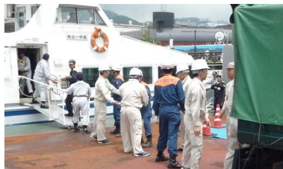
H26.6.28 松山観光港～呉港の相互支援訓練

「海ネット協定」の締結会員間において、 防災ネットワーク機能の強化 のための情報共有や、 情報伝達訓練及び基礎的防災訓練等を実施 。平成25年には「海ネット協定」が日本港湾協会企画賞を受賞。