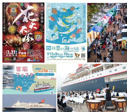
Webサイト「海の路」掲載情報 (イベント情報(左) 史跡紹介(右))

Webサイト「海の路」や公式SNSにて会員自治体で実施するイベント情報や、瀬戸内の「遊ぶ・食べる・学ぶ」などの 魅力を発信 。