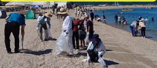
リフレッシュ瀬戸内(R6.7.7) 尾道市瀬戸田

・平成5年から累計約20,000トンのごみを回収。 令和7年度は全235ヶ所で約163トンをごみを回収