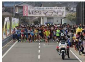
ゆめしま海道いきなマラソン