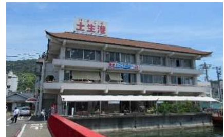
代表施設(尾道市) 土生港旅客ターミナル

※みなとオアシス: 旅客船ターミナル、文化交流施設、みなとの資料館、情報提供施設、地元産品の物販施設や飲食施設などで構成されています。「みなとオアシス」の詳細は別紙-1、「みなとオアシス因島・上島」の詳細は別紙-2~5をご参照願います。