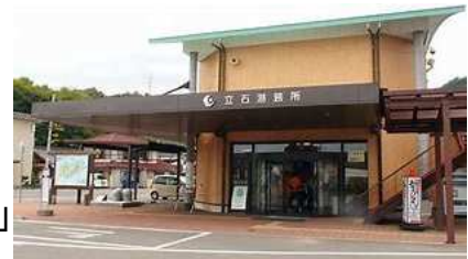
代表施設(上島町) 立石港待合所