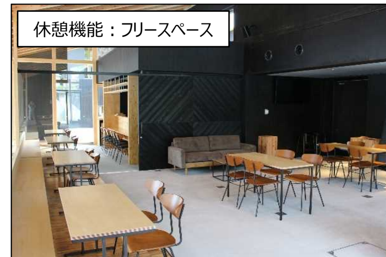
休憩機能：フリースペース