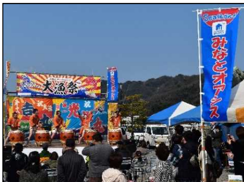
地域振興イベントの開催状況