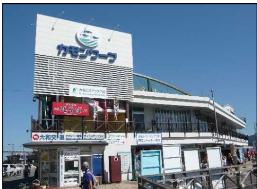
構成施設のイメージ