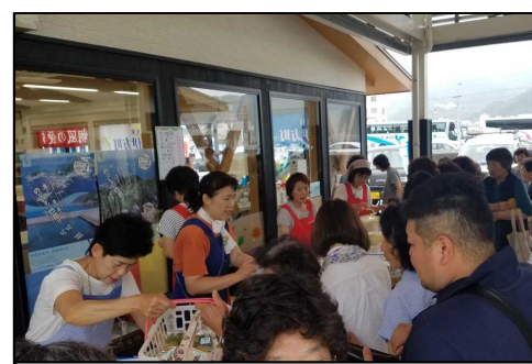
佐田岬メロディー市