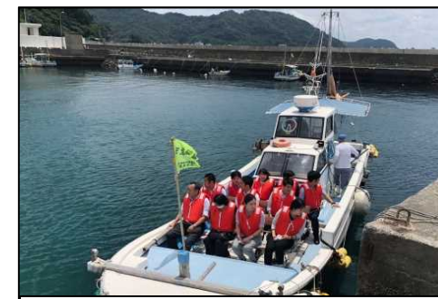
漁業体験クルージングツアー