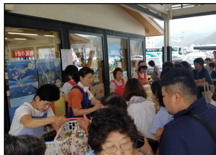
佐田岬メロディー市