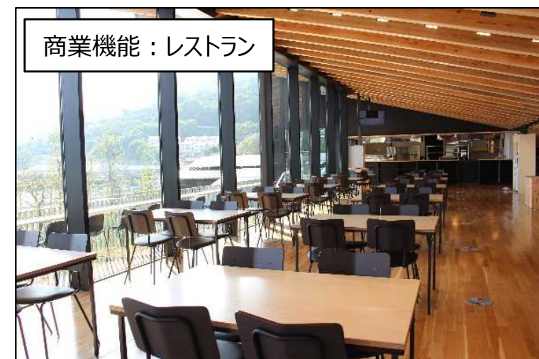
商業機能：レストラン