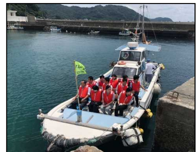
漁業体験クルージングツアー