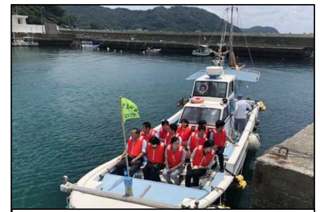
漁業体験クルージングツアー