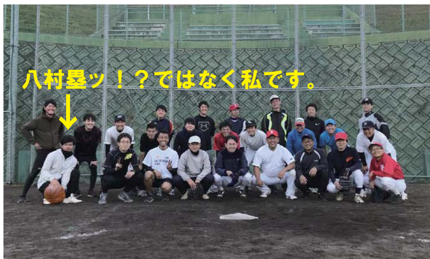
秋の野球大会集合写真

今後も公私ともに充実させ、「よりよい港づくり」を目指して取り組んでいきたいと思っておりますので、よろしくお願い致します。