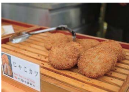
サクサクじゃこカツ

サクサクとした食感が子どもから大人までの幅広い層に受け入れられ、グランプリは逃しましたが全国3位に輝きました。