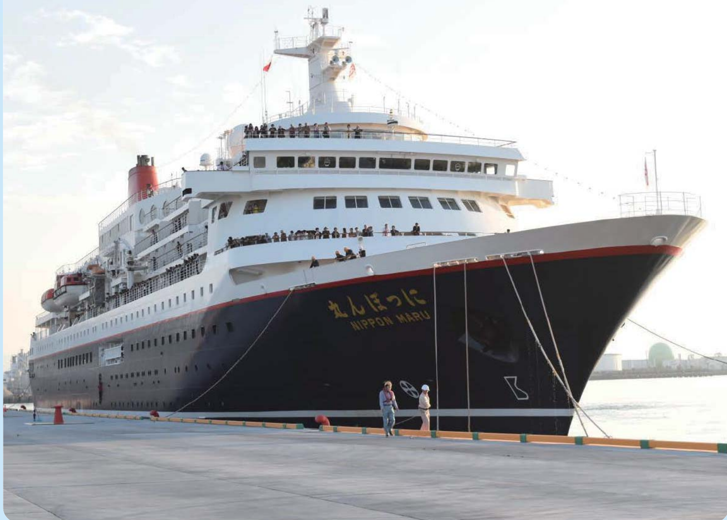
R1.10.28 松山港外港地区「にっぽん丸」寄港