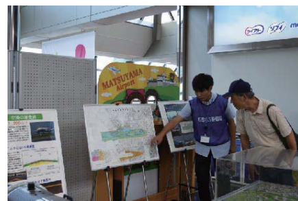
パネルによる紹介