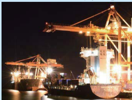
松山港 2隻同時着岸