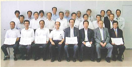
▲受賞者のみなさん、おめでとうございます。

7月28日、当所では「国土交通day」にあたり、所長から港湾関係建設功労者を表彰しました。今回表彰されたのは、右記の7団体の皆様です。(敬称略)