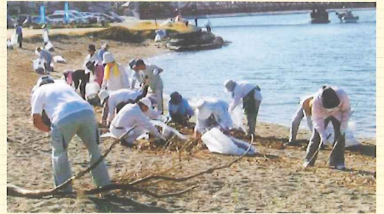
▲楽しみながらの清掃活動

こうした様々な活動が、きれいで豊かな瀬戸内の海を守っています。海水浴や散歩など、海岸を利用する際は、瀬戸内を愛するみなさんの努力に感謝し、また、これからもこの美しい海岸を大切に受け継いでいくことを心がけたいものです。