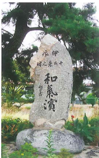
▲▼伊予十二景記念碑

毎月の定例清掃（50～60名）は、どの顔も楽しげに見える。20年の自信、そして次の20年へと受け継がれる意志を確信し、この和気浜創生に関わったすべての人に感謝したい。