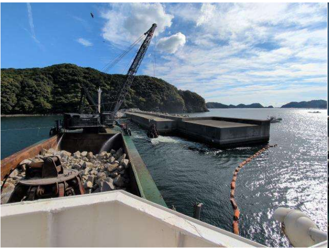
①東防波堤 基礎工(R8.2撮影)