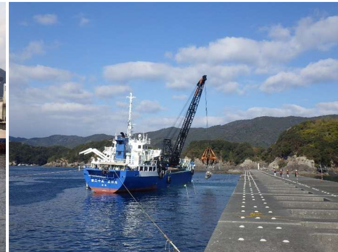
②防波堤(I) 被覆・根固工(R8.2撮影)