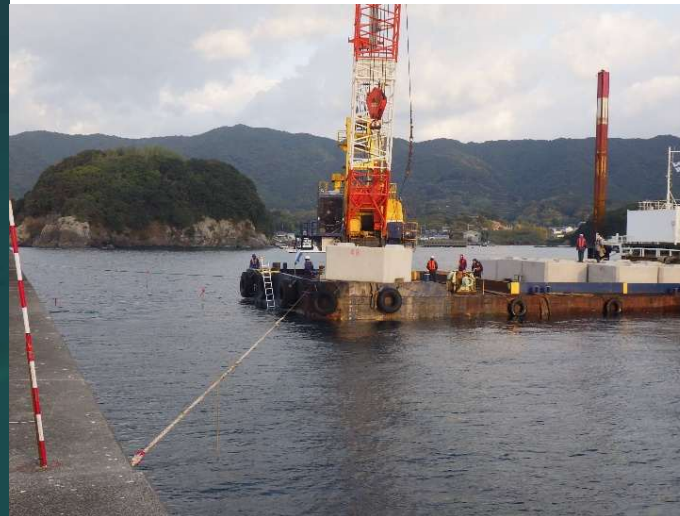
①防波堤(I) 被覆・根固工(R7.12撮影)