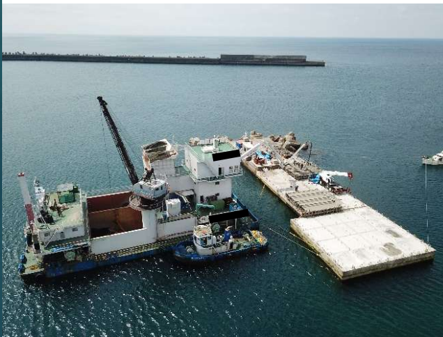
①防波堤(II) 上部工(R6.4撮影)