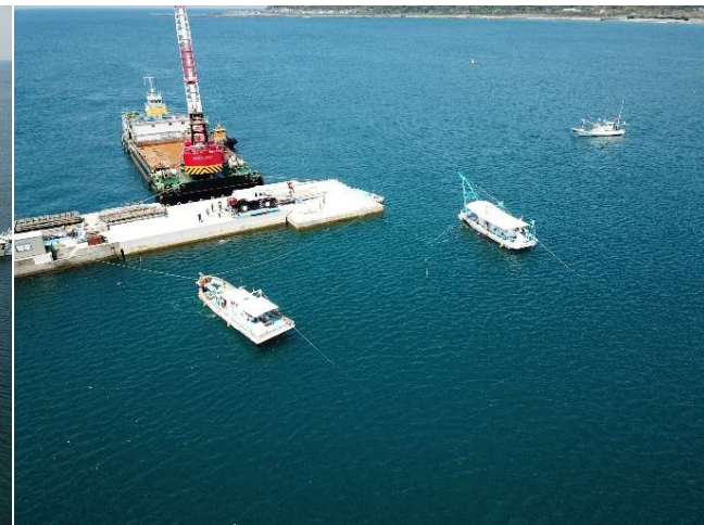
②防波堤(II) 基礎工(R6.4撮影)