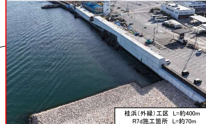
桂浜(外縁)工区 本体外工(R8.1撮影)

津波防波堤(桂浜側) L=約80m、R7d施工箇所 基礎工 津波防波堤(種崎側) L=約150m、R7d施工箇所 ケーソン2函据付