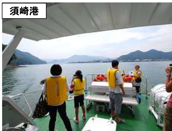
みなとウォッチングの様子