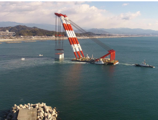
ケーソン曳航作業：午前9時～