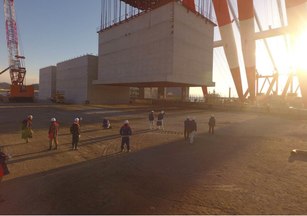
ケーソン吊上作業：午前7時30分～