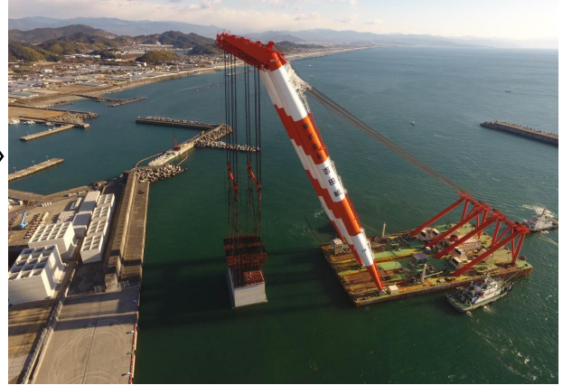
ケーソン吊出作業：午前8時～