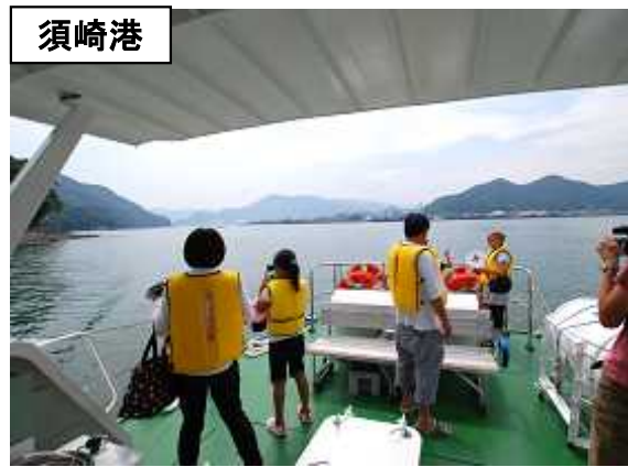
みなとウォッチングの様子