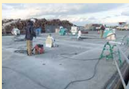
(a) 舗装版撤去状況(11月)