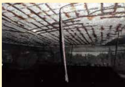
(a) 床版コンクリート(裏面)