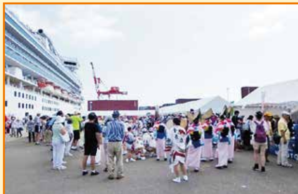
8月13日「ダイヤモンド・プリンセス」寄港