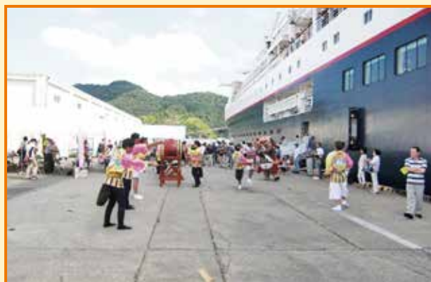
8月15日、18日「にっぽん丸」寄港