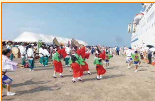
8月14日「ばしふいっくびいなす」寄港