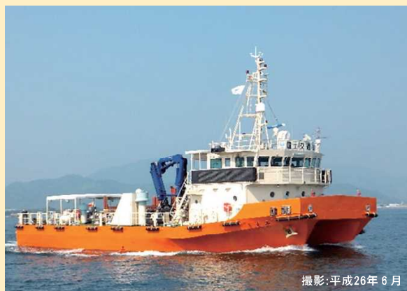
↑ 海洋環境整備事業

海面を浮遊する「一般ゴミ」や「流木」の回収及び浮遊油の回収に取り組み、航行船舶の安全確保、海洋環境の保全を担っています。