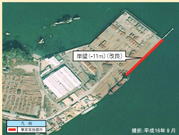
↑ 港湾整備事業(金磯地区)

今年度より、建設後40年近く経過している岸壁(-11m)の改良工事を実施します。