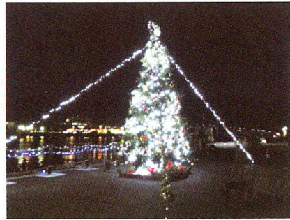
高さ約6mの巨大クリスマスツリー