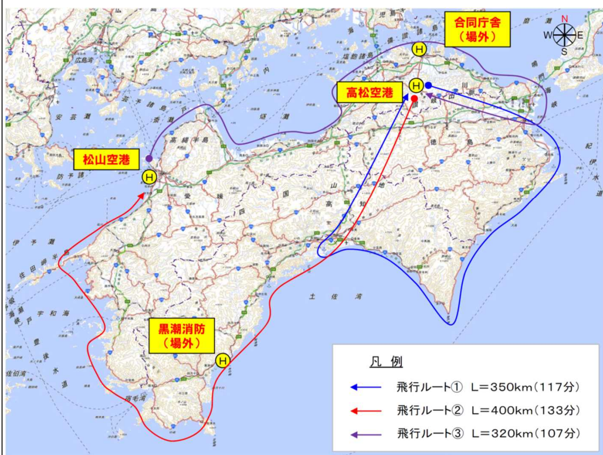
タイムスケジュール