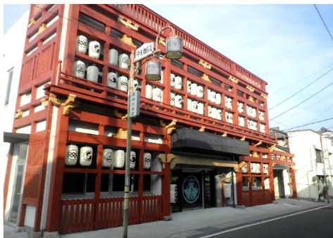
須崎大漁堂（代表施設）