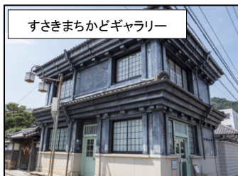
すさきまちかどギャラリー