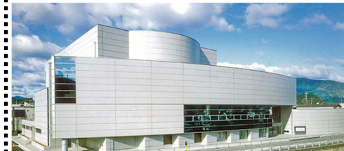
須崎市立市民文化会館

海のまちを象徴する港を眺望できる大型文化交流施設です。グランドピアノを保有し、反響板を使用してのコンサートでは豊かな残響が素晴らしいと様々なプレイヤーから絶賛されている多目的大ホールを持つ施設です。そのほかにも和室から大会議展示室まで様々な用途に合った活用が出来る施設となっています。