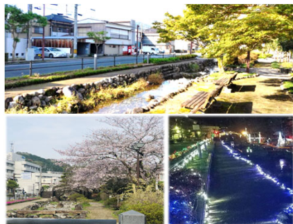
川端シンボルロード

東西約800メートル、幅20～30メートルの須崎のメインストリートです。小川が流れ、散歩道もあり、市民の憩いの場となっています。春は桜並木でお花見を楽しめ、冬には並木にイルミネーションが灯され、幻想的な空間を創出しています。また、新春恒例行事となっている海のまちを走り抜けるロードレース大会ではメインコースとなっています。