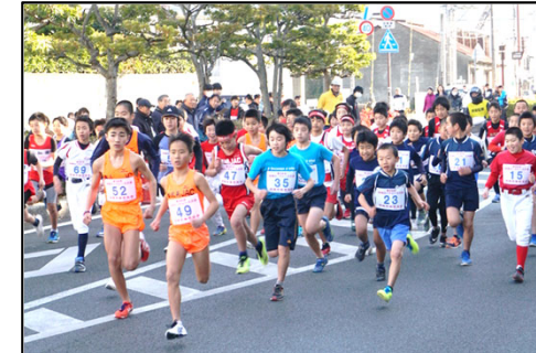
須崎ロードレース大会