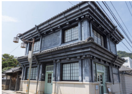
すさきまちかどギャラリー

1916(大正5)年頃築といわれる塗屋造りの建物を活用した施設です。貸しスペースとして一般の利用も可能で、会議やワークショップなど、市民グループ等の文化活動の場となっています。また、歴史ある町並みの旧市街区や、自然豊かな新荘地区を楽しんでいただくため、レンタルサイクルも行っています。