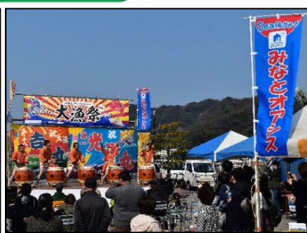
地域振興イベントの開催状況