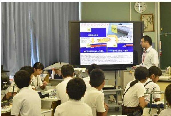
防災に関する講義の様子