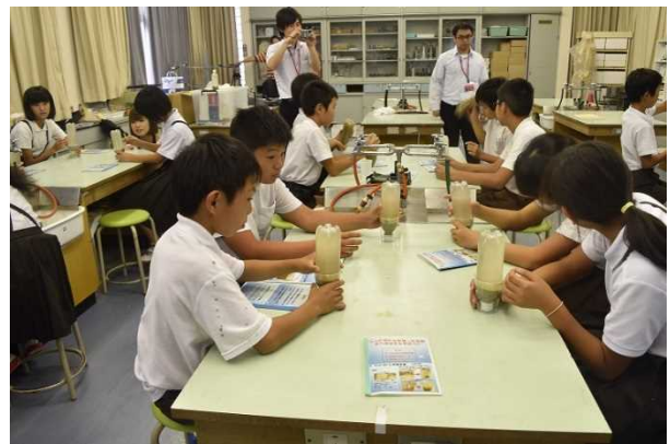
液状化実験の様子