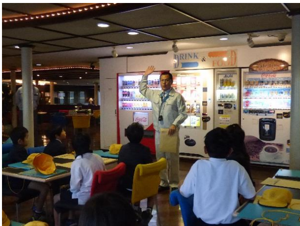
フェリー船内レストランにて事業概要説明