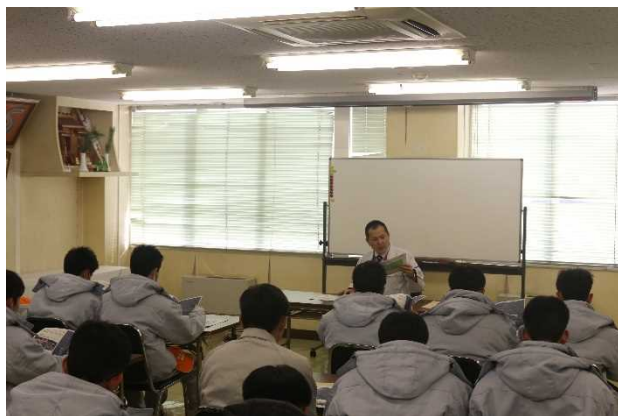
事業概要の説明状況