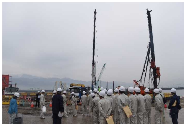
工事現場の見学状況