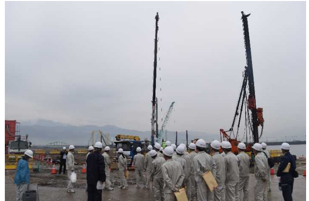
工事現場の見学状況