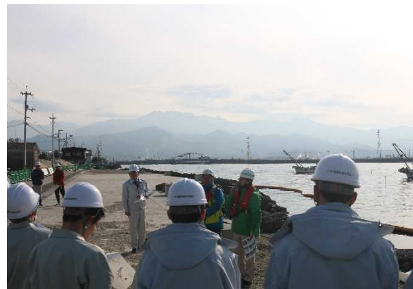
工事現場の見学状況