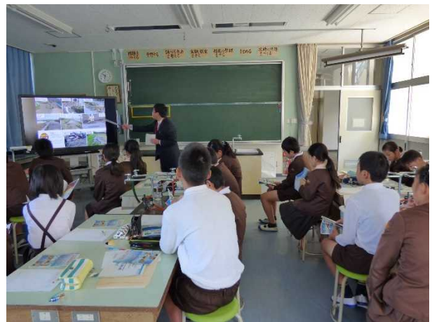
防災に関する講義の様子