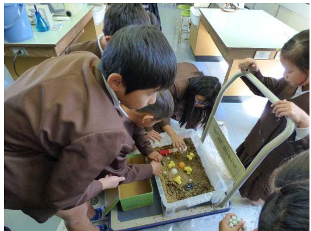
液状化実験の様子