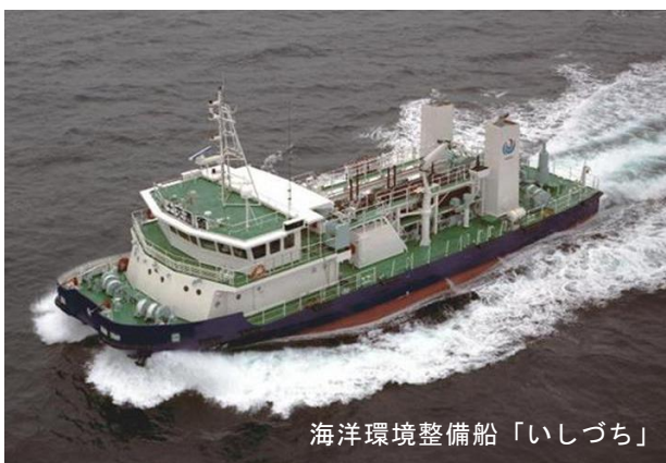
海洋環境整備船「いしづち」

帰還時の取材を希望される場合は、到着時刻にあわせて上記場所にお集まり頂きますようお願いいたします。