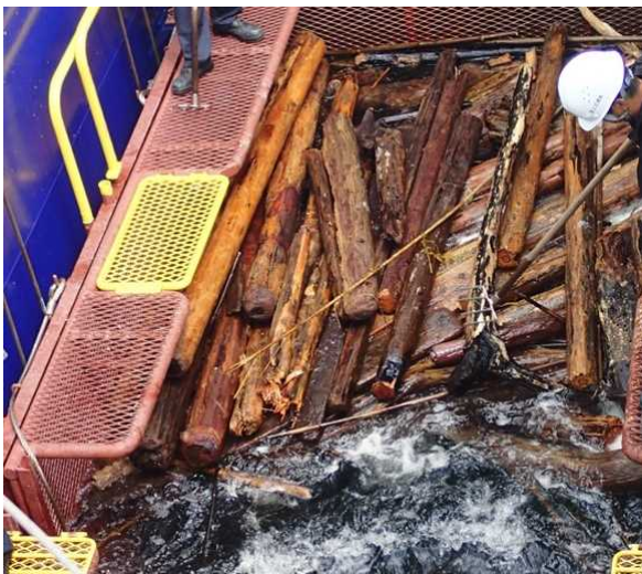
船上での流木回収作業