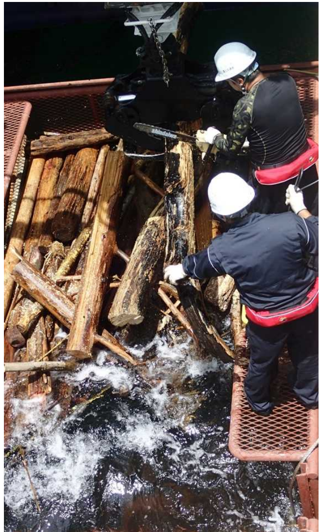
船上での流木切断作業