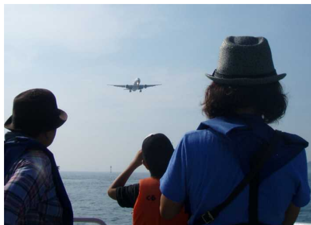
間近で飛行機を見ることも出来ます