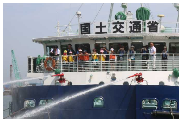
大迫力の放水銃の見学