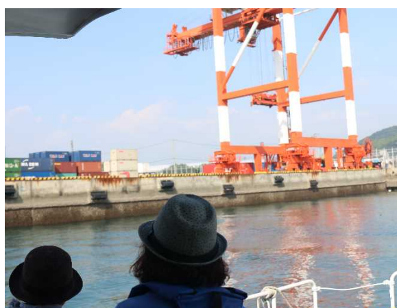
「くるしま」にて港の役割を学習