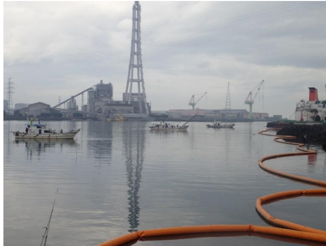
潜水士船による基礎捨石均し