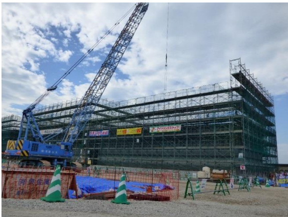
ケーソン製作状況