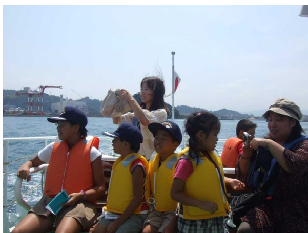
▲『くるしま』で松山港、松山空港を見学