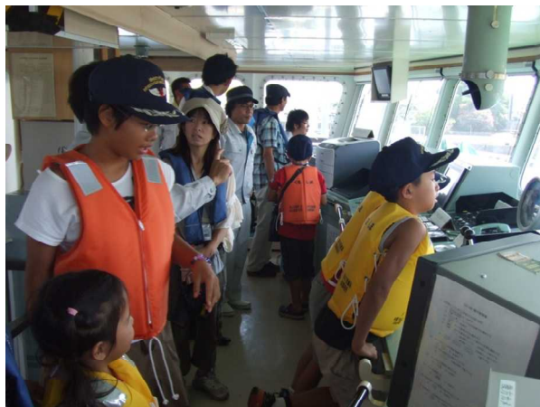
▲『いしづち』の操舵室内の見学の様子