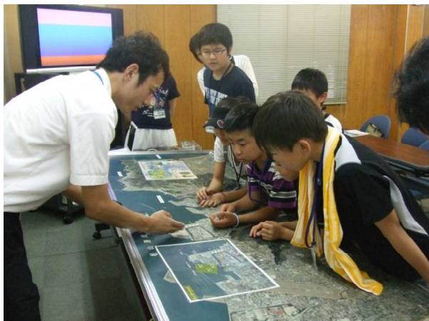
▲熱心に説明を聞く子供たち