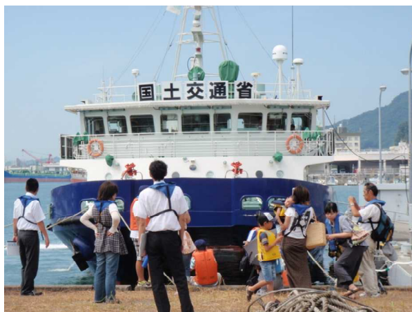
▲正面から見る『いしづち』にも興味津々