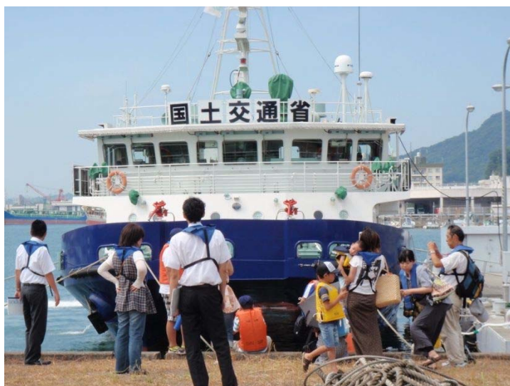
▲正面から見る『いしづち』にも興味津々