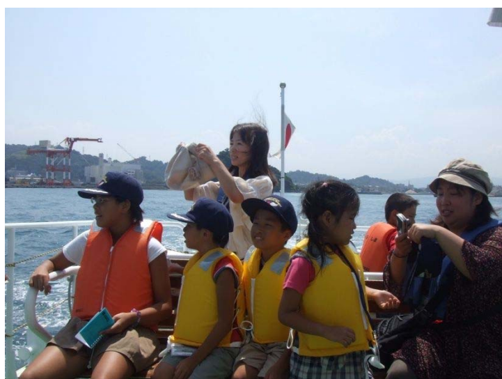
▲『くるしま』で松山港、松山空港を見学