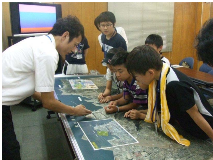
▲熱心に説明を聞く子供たち