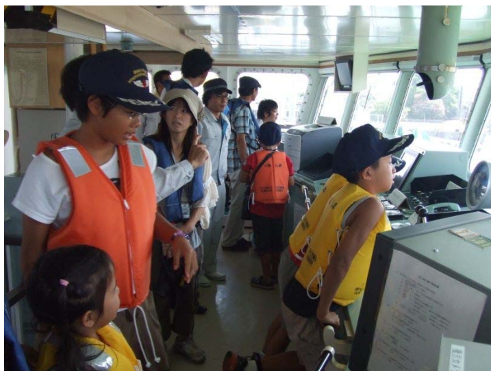
▲『いしづち』の操舵室内の見学の様子