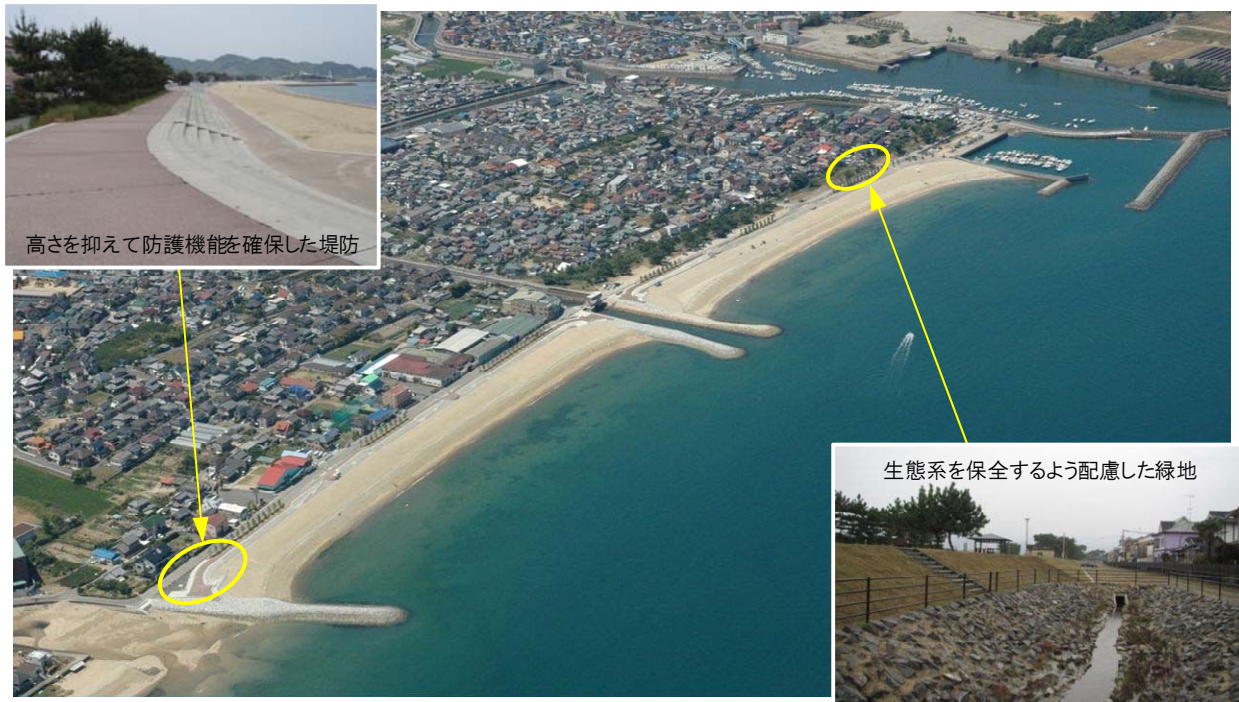
完成した松山港海岸、和気浜緑地