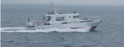
港湾業務艇「くるしま」 情報収集作業状況