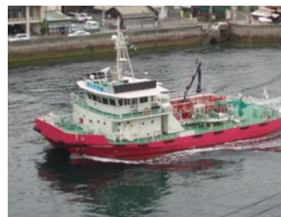
海面清掃船「おんど2000」