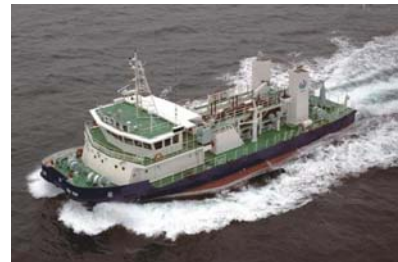
海面清掃船「いしづち」