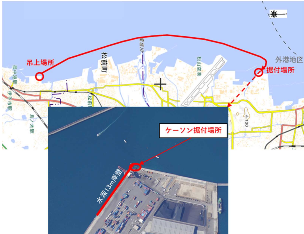
(国土地理院地図(標準地図)を基に松山港湾・空港整備事務所が作成)