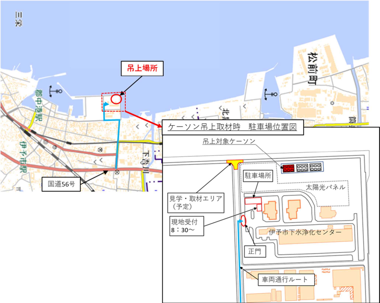
(国土地理院地図 (標準地図) を基に松山港湾・空港整備事務所が作成)