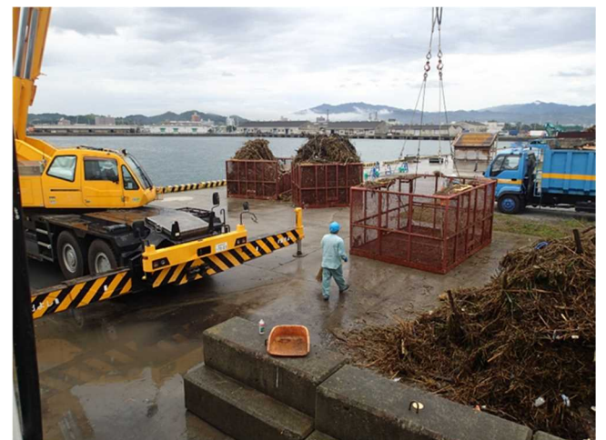
「いしづち」からクレーンにより流木等を陸揚げ