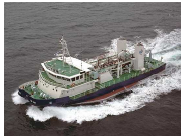
海洋環境整備船「いしづち」