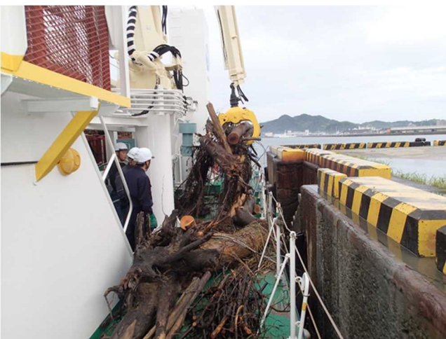
「いしづち」からクレーンにより流木等を陸揚げ