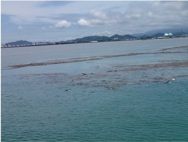
流木等漂流物の状況