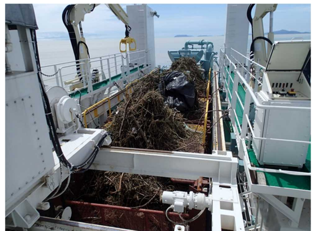
流木等で満載になった 「いしづち」の回収コンテナ