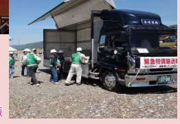
救援物資輸送・避難所運営訓練