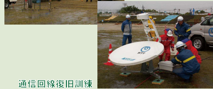
通信回線復旧訓練