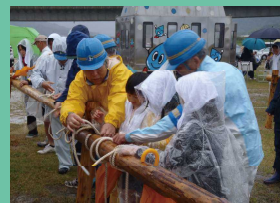
ロープワーク体験