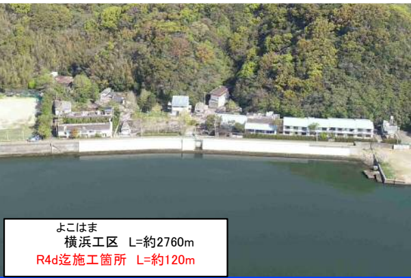
浦戸湾地区 横浜工区 本体工(R5.3撮影)