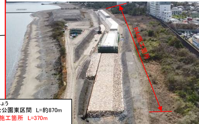
種崎(外縁)工区 千松公園東区間 本体工(R5.3撮影)