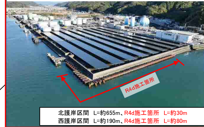
タナスカ工区 北護岸・西護岸 本体工(R4.12撮影)

北護岸区間 L=約655m、R4d施工箇所 L=約30m 西護岸区間 L=約190m、R4d施工箇所 L=約80m