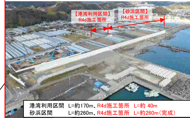
種崎(外縁)工区 港湾利用区間・砂浜区間 本体工(R5.1撮影)

【港湾利用区間】 R4d施工箇所 L=約40m 【砂浜区間】 R4d施工箇所 L=約260m(完成)