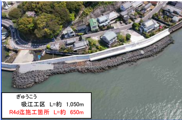
高須地区 吸江工区 本体工(R5.4撮影)