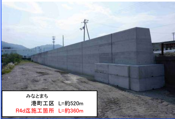
潮江地区 港町工区 本体工(R5.5撮影)

【港湾利用区間】 R4d施工箇所 L=約40m 【砂浜区間】 R4d施工箇所 L=約260m(完成)