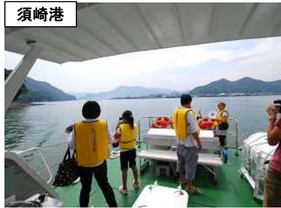
みなとウォッチングの様子