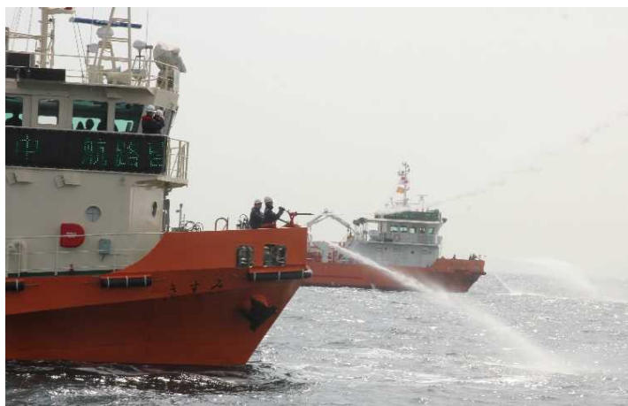
浮遊油の放水拡散