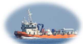
海面清掃兼油回収船「みずき」