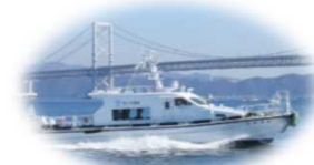
港湾業務艇「ひのみね」