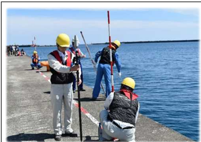
訓練イメージ写真