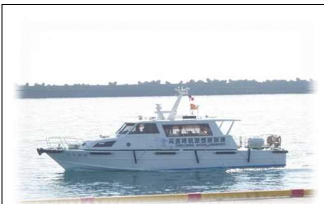
訓練イメージ写真（探査ソナー搭載船）