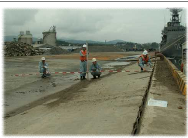
災害時イメージ（柏崎港：中越沖地震）