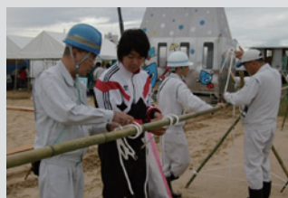
ロープワーク体験