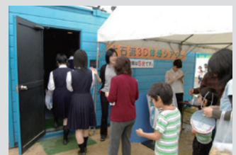
土石流3Dシアター体験