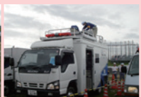
携帯電話回線復旧訓練