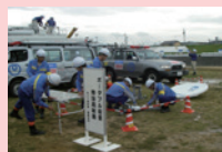
特設公衆電話設営訓練