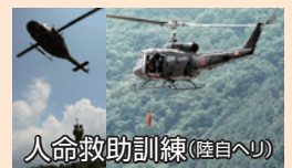
人命救助訓練(陸自ヘリ)