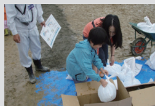
家庭でできる水防工法体験