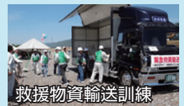
救援物資輸送訓練